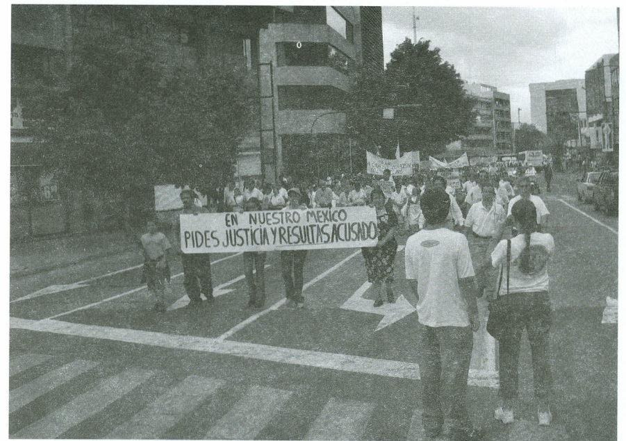
Foto: "Marcha por la Verdad y la Justicia" en Guadalajara, Jalisco, 28 de Septiembre del 2003