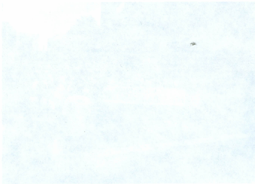
Foto: "Marcha por la Verdad y la Justicia" en Coahuila, febrero 28 de septiembre del 2002